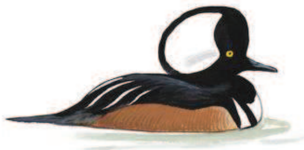
Ilustração @ David Allen Sibley